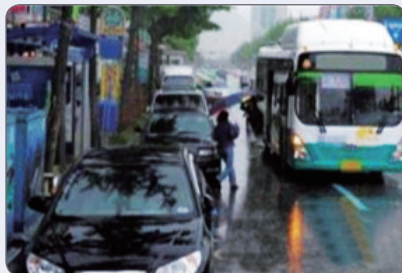
버스 정류소 10m 이내 불법 주·정차

도로 한복판에서 승·하차하면서 교통사고 위험 및 뒤따르는 차들의 주행을 막아 2차 교통사고 야기