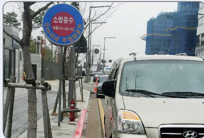
소방시설 주변 5m 이내 불법 주·정차

화재진압 골든타임(최초 발화 후 8분)이 지연되어 화재 사망자 증가 및 대규모 재산 피해 발생