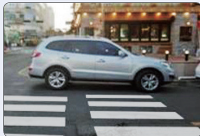
횡단보도 불법 주·정차

횡단보도를 가로막은 불법 주·정차 차량으로 보행자들이 차도를 이용하게 되어 교통사고 위험