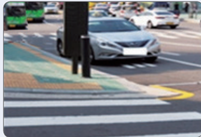
교차로 모퉁이 5m 이내 불법 주·정차

교차로 모퉁이 불법 주·정차는 모퉁이를 도는 운전자의 시야를 방해해 보행자의 안전을 위협