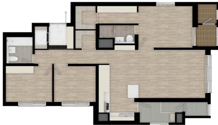
84 확장 평면도