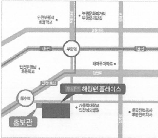
현장 및 홍보관 위치도