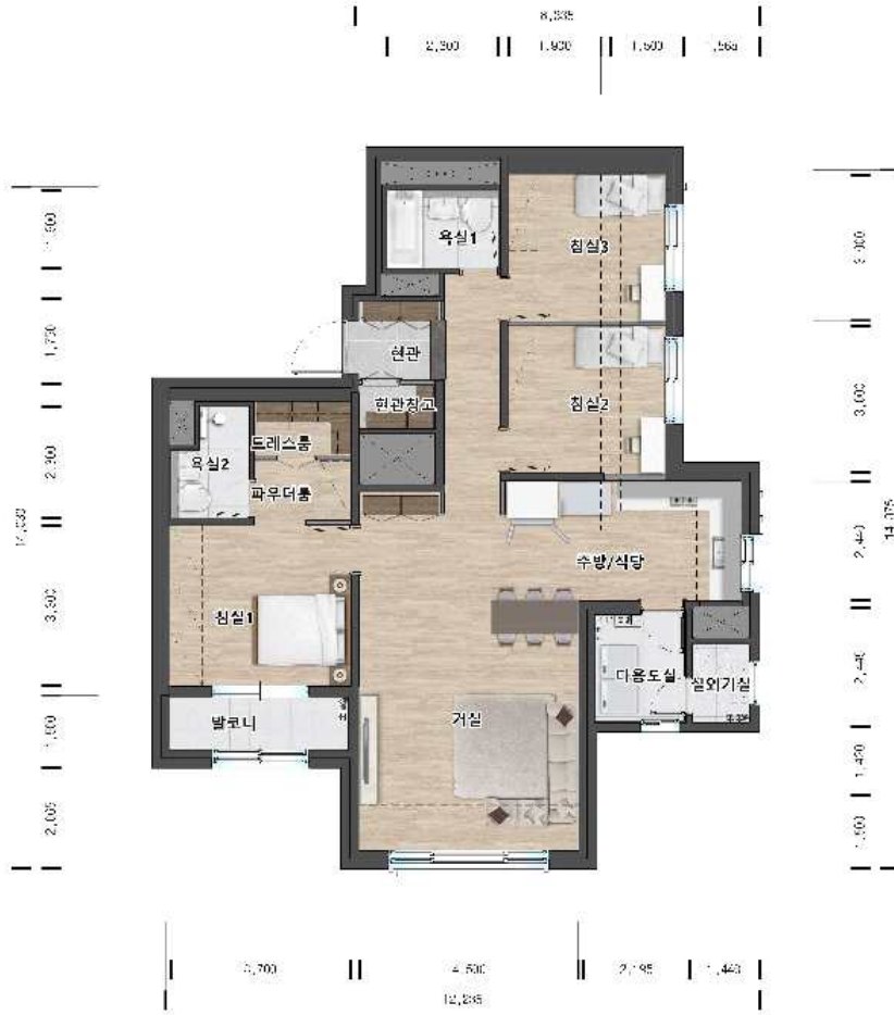
84C㎡ ( 58세대 )