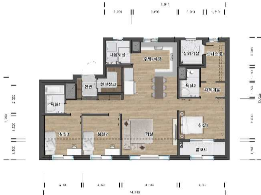
84A㎡ ( 371세대 )