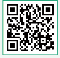
TV기능 설명 영상