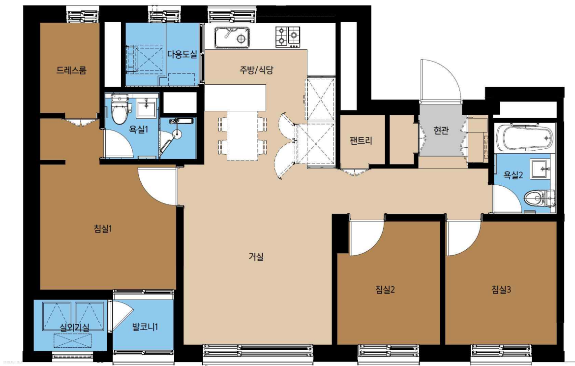
59B형 단위세대 평면도