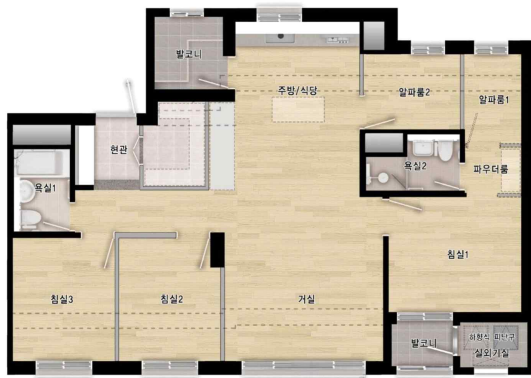
[ 74A형 ]