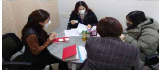
▲ 관계자 간담회