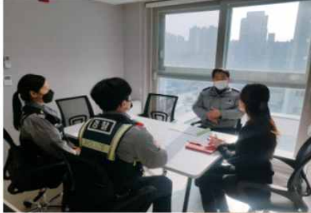
▲ 지역자원 연계협력 네트워크