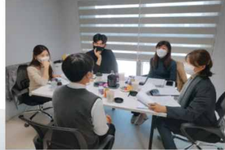
▲ 입주자 선정심의위원회